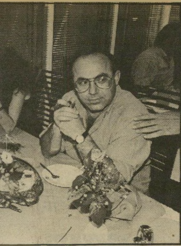
נינה (מש) לטוענר מו עים חברתיים עם בעלה. השניים נראו

עד לפני שנה וחצי הוא היה הבעלים של פאב הרצל ברחוב ירמיהו, מקום מושג של רבים מאנשי הבורסה והבידור, שהיו פוקדים את המקום