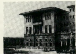
קאזינו ומועדון הלילה

לא הרחק מאיסטנבול, על החוף המרהיב של ימת מרמרה נמצא פאר המלונות הטורקיים.