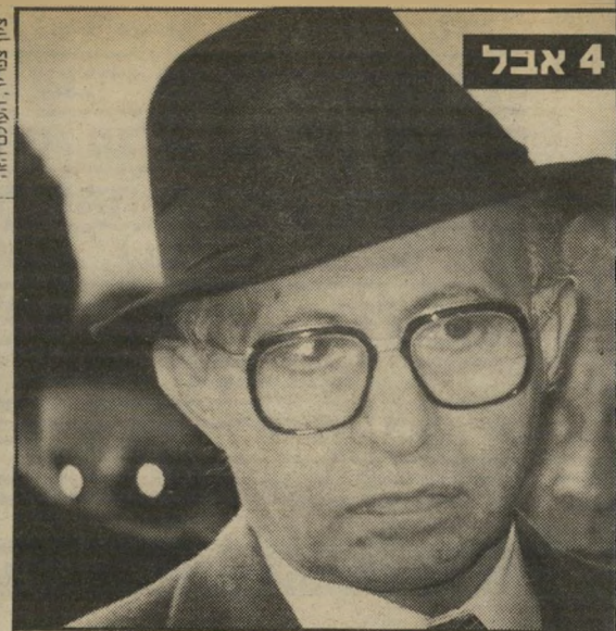
מכה. בהלוויית עליזה בגין