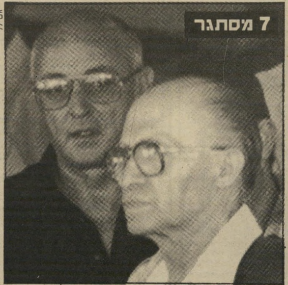
ומאז ועלמו עיקבותיו