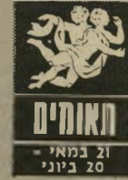
ת'אומים 21 במאי - 20 ביוני