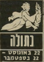
כ'תולה 22 באוגוסט - 22 בספטמבר