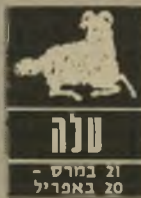
ט'ורה 21 במרס - 20 באפריל