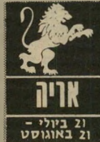
א'ריה 21 ביולי - 21 באוגוסט