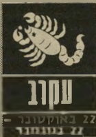
ט'קורדו 22 באוקטובר - 22 בנובמבר