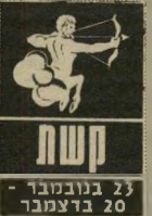
ק'שת 23 בנובמבר - 20 בדצמבר