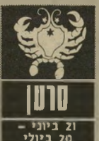
ל'ונון 21 ביוני - 20 ביולי