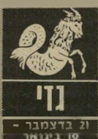
ג'מני 21 בדצמבר - 19 בינואר

ההרגשה הרבה יותר טובה. בין ה-7 ל-9 בחודש תוכלו ליהנות מהרפתקות רומנטיות, מפגישות מיקריות ומהצלחות בדינרים שכלל לא תיכננתם. ענייני כספים ידרשו טיפול זהיר ועיוני. במקום-העבר, דה צריך להיות זהיר רים ביחס עם המימונים. מצפה לכם שבוע די לחוץ. הם מרשים לעצמם לבוא בדרישות כמעט מעליבות. כדאי להביג. אין זה הזמן להיכנס למאבק-כוח.