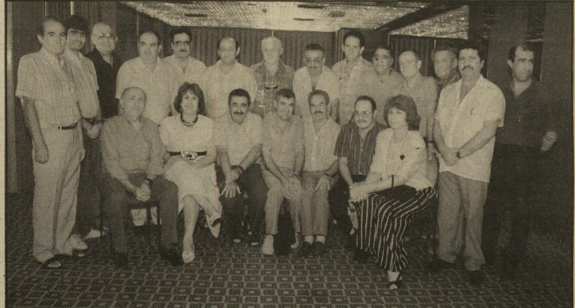
כנס מושתלי-הלב הישראליים. מדוע הנשים אינן חולות?