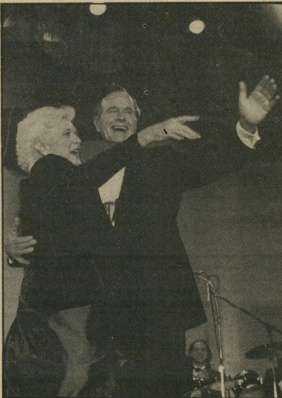
הזוג הנשיאותי בוש בהכתרה הנבחרת היוצאת נראית כמו זודה מושעת

העם האמריקאי מתחיל אט-אט להירגע מהחילופים הגריאטריים, שנעי רכו זה לא מכבר בבית הלבן. הוגו הנשיאותי הקודם, ננסי רונולד רגן, חזרו לחוותם שבקליפורניה, כאשר ננסי סוחבת איתה כ-7000 שמלות, שהיא שאלה, בלי להחזיר כמו, ממעצבים שונים, ואשר 6975 מהן ארומות. מישו פעם שיקר לה שארם הולם אותה ומאו נראים ארונות-הבגרים שלה כמו סיוט סובייטי. רונולד, לעומתה, לקח איתו רק כמה עזרי-שמיעה חיוניים, קטטר, ואת ערכת-החוקן האישית שלו שהוא מאוד קשור אליה. השניים סיגלו לעצמם הרגלים מאוד מוזרים בשנה האחרונה לכהונתם. הוא כבר לא שמע כלום. מה שהוא שמע בכל זאת, הוא היה בטוח שזה לא נאמר לו, ומה שבכל זאת אמרו לו הוא לא זכר. הוא רק חייד כל הזמן, ויחד איתו חיכך מיליוני אמריקאים נאיביים. סולידריות, כאילו.