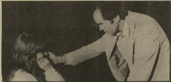
הדיקטטור (תרשיש בתפקיד רוזן) ונבול הציות

● ליאת בן-חביב (ליאורה כהן צגה): "כל אדם חייב לכבד את הדיוק. אחרת תיווצר אנארכיה. אנח