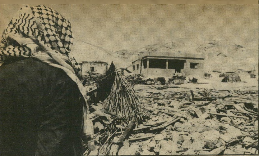
הבית ההרוס בעקבת ג'אבר בני הנלים