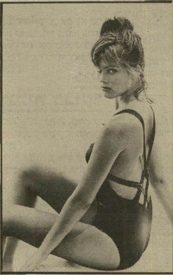
דוגמנית סימונסון נמרו, ורצו לספר לחברה בחדשות

להיפרר בשלום, יהודים לכאן וערבים לשם, זו התפיסה ההולכת ורווחת בציבור היי-הודי. סימן להלך-הרוח ניתן לחוש בראיון עם מנהל בית הנפן בחיפה: אין היענות מצד יהודים לפעילות המרכז, שחרט על דיגלו את הדריהקים ואחיות-העמים. מיספר היהודים, הבאים למיפגשים בצוותא הולך ופוחת. יותר ויותר אנשים משני קצוות המפה הפוליטית מגיעים למסקנה כי דיוקים בין פלסטינים וישראלים אינו אפשרי. משמאל מדברים על "גירושין", "חיץ ריבונני", "חומה". מימין מטי-פים ל"איזור יהודי ואיזור ערבי", ועל "היפר-רות". המינימליסטים והמכסימליסטים חלו-קים רק על גודל מרחב המחיה הנחוץ לנו, והיכן יעבור קו ההגנה — על גדות הירדן, או על גדות הירקון.