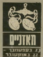
האדנים 22 באוקטובר 22 בספטמבר

אתם זוכים לעליה בפופולריות בקרב המון השני, הננים מקשרים חרשים או מהידוק היחסים ה' קיימים. אבל יש ש' חים הדורשים מכם יותר ויתור ושיתוף' פעולה. אין זה הזמן להתעקש על רצונ' תיכם. בעבודה קצת קשה. משהו מנסה לדחוק את רגליכם, אבל זה לא יילך. ב' כספים מסתמני שיפ' קל. נצלו את התקופה, אך הימנעו מ' הוציא כספים למטרות שאינן הכרחיות.