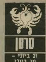
סרטן 21 ביוני 20 ביולי