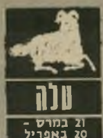
טלה 21 במרץ 20 באפריל

היכריות חדשות יגוונו את התקופה ויקלו על ההרגשה. לא קל בעבודה וב' חיי המיטפחה. כדאי שתפנו את הפעילויות הרבות שלכם לתחו' מים אחרים שבהם יכול להיות טוב יותר. אפשר ליהנות מטיו' לים, מיפגשים חבר' ייים, לימודים ונסי' עות. לא להתלהב מ' די ולא לאבד את ה' שימוט ההגייוני, כדי שהשימחה לא תיהפך לאכזבה. ה' 28 וה' 29 קצת קשים. חשוב לנוח הרבה.