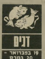
דגים 19 בפברואר 20 במרץ

ענייני מגורים מסרידים אתכם. דברים מח' קלקלים ואתם נכנסים להוצאה כספית לא מתוכננת. העניין הוא ש' אייפארה לוותר על אד' תם דברים. אין זה הזמן להחליט לשפץ או ל' ארנו את הדירה בצורה שונה ואל תתעקשו על זה. זה יקח יותר זמן ו' כסף ממה שזוהי יקח. בזמן מתאים יותר. ה' 26 ו' 27 ייתכן ויכוח עם משהו קרוב מאוד. זה עלול להתפתח לריב גדול. הכוח יחזיר אליכם ב' 28 בחודש ואז יפתרו הרבה בעיות.