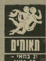
תאומים 21 במאי 21 ביוני