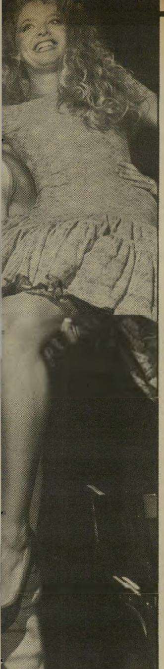
תאומות על הגובה המרשים בגובה ובמידות, נושא