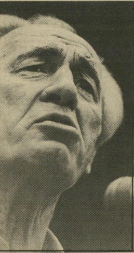
פרס טיפול שמרני עדיף

חלק חשוב מאוד בטיפול הוא רפואה מונעת. במיקרים רבים ניתוח למנוע את הגדלת הערמונית על-ידי מתן ייעוץ נכון לגבי שינויים