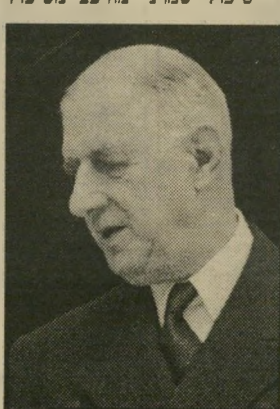
דה-גול ירידה מן הבימה

הטיפול במחלה זו מחולק ל-שני חלקים: טיפול שמרני ו-טיפול ניתוחי.