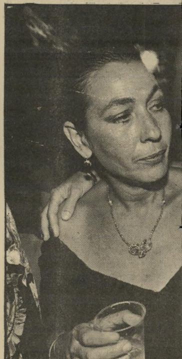
עולם, באה לאירוע בחברת בנה וכלתה. תשומת-הלב שעוררה אצל אנשי-התיק עימם פעולה. בעלה הוא ממממני הסרט.

הסרט, שמיסטיקה ומציאות מתערבבים בו יחדיו, העלה את הרד גמנית רזנית אלקבין למדרגה גבוהה יותר מאשר עוד רוגמנית צילום ומסלול. כיאה לכוכבת במי עמדה החדש היא הגיעה רק בשעת לילה מאוחרת, אך עד לבואה ניתן היה ליהנות מריקודים בחברתם של אנשי ההסרטה. במירפסת התחתון נה החליפו אנשי קולנוע ותיקי שורת ביקורות ומהלומות מילר ליות, ומי שאורו כות ירדו למישי את והשקיפו על המסיבה מרחוק.