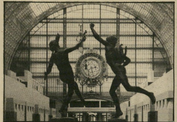
השעון הגדול והפסלים, לאחר השיפוץ — מוסיאון