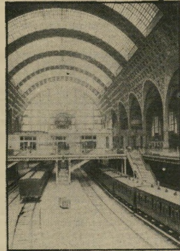
לפני השיפוץ — תחנת רכבת

יש במוסיאון גם מיסעדה, כי מיפסל המציע, והיא פתוחה ל־ארוחות צהריים וערב בימים ובש־