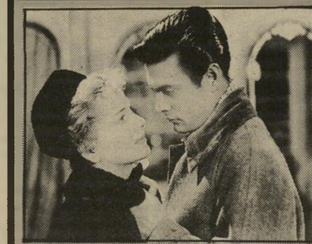
לואי ז'ורדן וג'ון פונטיין: פנינה אמיתית

*** ארבע הרפתקות של רנט ומיראבל (לב, מוצג גם