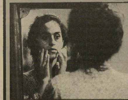
ריטה: פלורה התמימה לא מבינה

המדברות לא פחות מן השחקנים, הרמזיה, הבאה במקום אמירה - כל אלה הופכים הפקה הוליוודית שניגרתית-לכאורה מ-1948, לאחד הסרטים המופלאים שידע הקולנוע. ההסברים הארוכים על משמעות של תנו"עות-המצלמה הארוכות מסביב לתדרלה בלינץ או זוויות-הצלום המיוחדות, כל אלה לא הצליחו עדיין להרוס את קסם אמנותו של אומולס. אפילו ג'ון פונטיין נראית כאילו השראה מיוחדת ירדה עליה. מומלץ בחום.