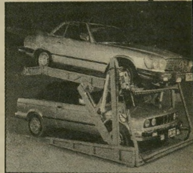
מכפיל החנייה האמריקאי 6950 דולר

יש שתי גירסות של הדרחניון. האחת, שמחירה 2000 דולר, המי חייבת הפעלה של בעלי-החניון, והשנייה, במחיר של 3000 דולר, שבה ניתן לחנות ללא סיוע. האמאכר שלי"מר, הכליבו די