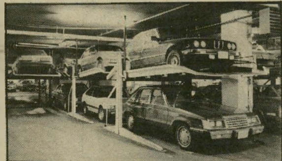
מכפיל החנייה הישראלי

נודע, מוכר גם הוא. מכפיל שטח חנייה, גם באמצעות הרואר. גם זה מופעל הידראולית. יתר הפר-טים הטכניים פחות חשובים. חשוב במיוחד המחיר. 6950 דולר. אם למפעל הישראלי יש משווק רזין, יהיה גם רווח נאה.