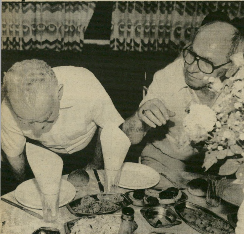
אפליהאב עם יצחק שמיר רכילות במיוון המצודה

בגובה הגדר יש חריגה. היא היתה אמורה להיג נשא לא יותר מאשר לשני מטרים, עם שיניים בגובה עד 3.2 מטרים. למעשה, גובה הגדר שלושה מטרים. ביתמישפט השלום בתלי אביב קבע שיש להרוס את חריגותהבנייה ולהתאימן לתוכניתבנייניערים, אך הדבר לא בוצע עד היום. לפני שנתיים, אחרי הסתככות עם החוק בעניין מטבעיחוק וחשר לשיחודו של מנהל כלא, עזב גניש את הארץ והותיר את החברה והרכוש בידיו של אפל. אפל השקיע את מירצו גם כעסקים וגם בתמיכה מאסיבית בדויד לוי, שכוחו במיפלגה ירד מטהמטה כשנים האחרונות. אבל הוא נותר בתפקירו