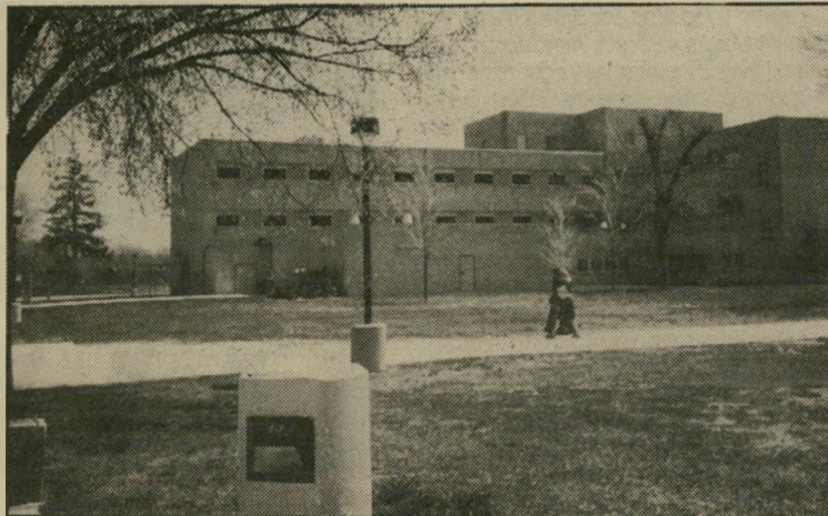
"המרכז הרפואי הפדרלי" ברוצ'סטר, נכון שזה נשמע נורא אישי ונשיק"

בתנאים לשלל ההצהרות וההתייבויות שנתתי בכתב, וערימות הנהלים שחוייבתי לקרוא, היה עלי לקבל את תגובת שילטונות-הכלא ה" אמריקאיים לטענותיה של אן מולארד. משרד-המישיפטים ושרות-בתי-הסו"הר הסמיכו לשם כך את ג'וזף בויגן, מנהל המיתקן ברוצ'סטר, מיניסוטה. בויגן נושא באחת המישרות הבכ"רות בשרות. דבריו הכנים והבלתי-י" נוסחים הצביעו עליךך שלמטבע ש" שמו אן מולארד יש שני צדדים. בין אם הצדק עימו ובין אם לאו — לא הייתי רוצה להיות בנעליו.