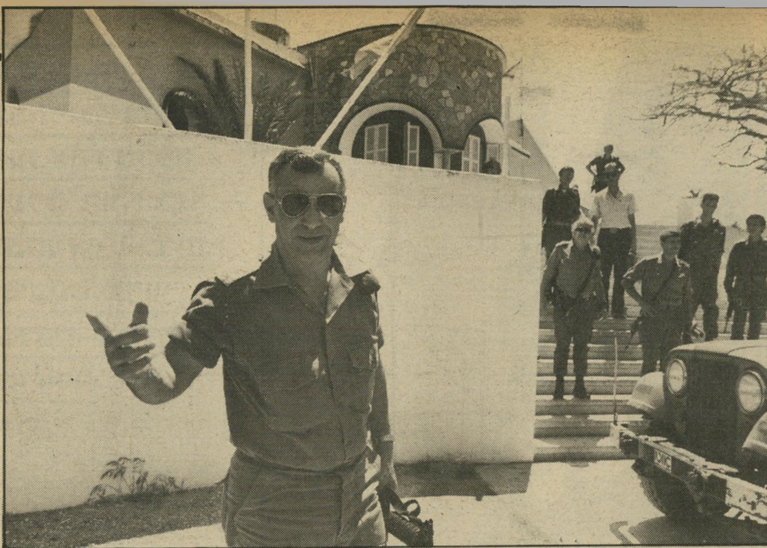
אלוף מרדכי במיפקדת מוג'יב בעזה מירצפוח מצוירות, חלוותו מקושחים

האלוף ביקש מקציני המימשל להכין 150 חבילות-מוון לנצרכים לכבוד חג עיד-אל-פיטר, החל בסוף חודש הרמדאן. כישיבה הביע אחד הקצינים את תלונתו תיהם של העוזרים במחנה-המעצר אונצ'ר 3.