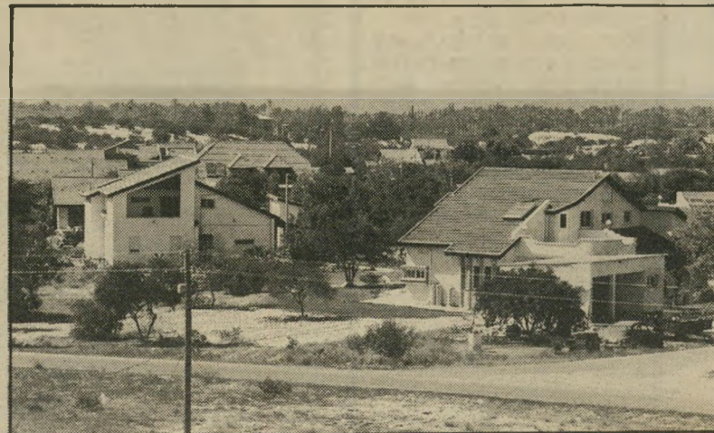
התנחלות גניטל (למעלה) ומחנה-הפליטים שאטי (משמאל)