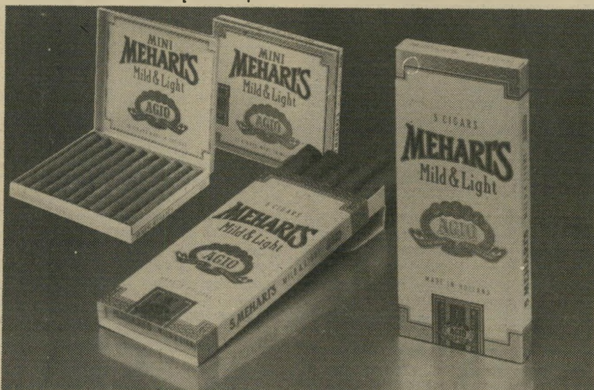
אזהרה: משרד הבריאות קובע כי - העישון מזיק לבריאות