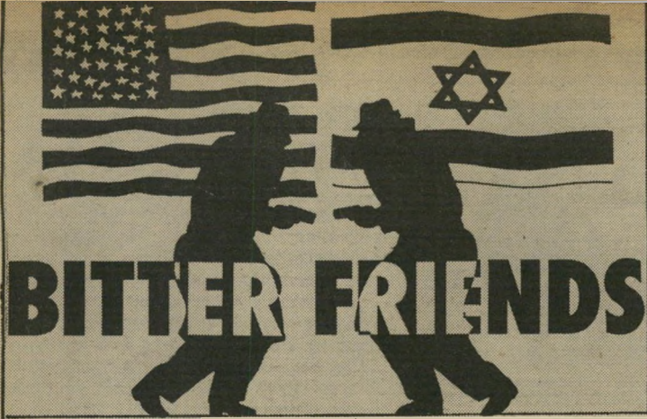
הברזה של "יודים מרים" צא החוצה מחחום השגוריות