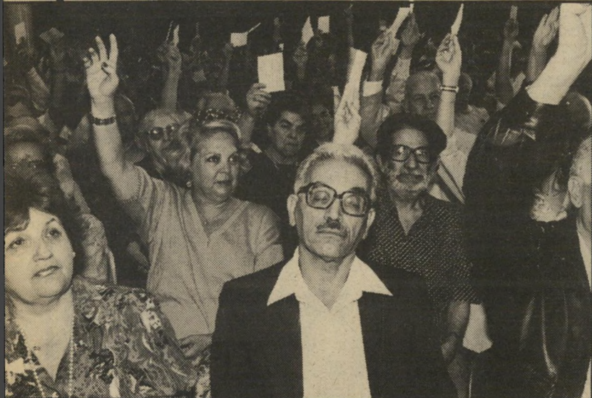
קיסר עצם את עיניו