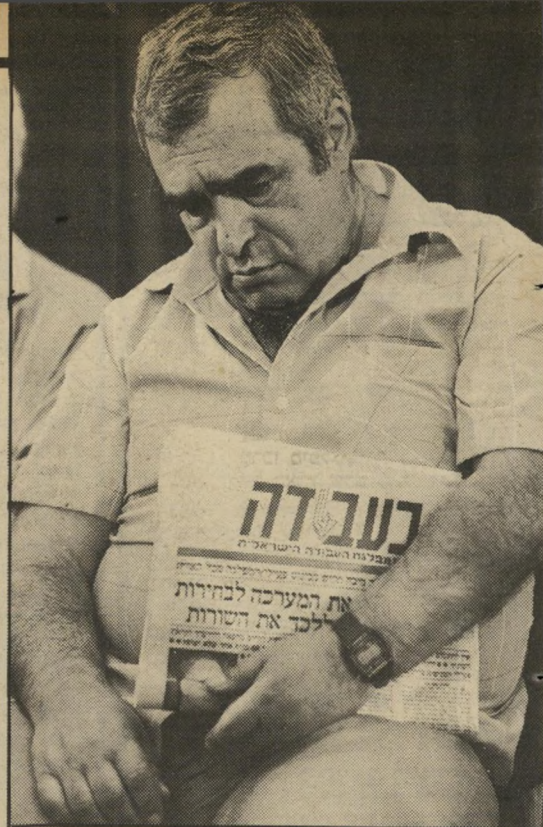
חבר אלמוני ישן