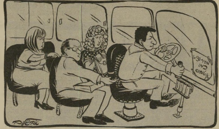
"הענישה מפריעה להתפתחות הרמונית התקינה של האישיות..."

י רדתי בתחנה המרכזית. צעתי כחצי קילומטר עד לאלנבי פינת-העליה. שם, באלנבי 123 כך אמרו לי, יש חנות מצויינת לחומרי-בניין ולכלי-עבודה, המצויינת להפ"ל. ז. וילנצ'וק ובנו, בני עבודה. רציתי לקנות זוג ידיות לבנות, פשוטות, לארון קסטנז. כבר בכניסה לחנות הרגשתי שאווירה עכורה שוררת במקום הזה. מי שלא מאמין לתיאוריה הטוענת שיש משהו הקרוי תיקשור רת לאימילולית, שלא יאמין. אני מאמינה. והתיקשורת הלאימילולית ביני לבין הובן,