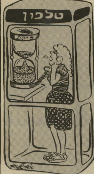
"שיחה מטלפון ציבורי כמותה כרולטה..."

ככה, בצעדים נמרצים ומאוששים, התחלתי לחפש טלפון ציבורי אחר. יהיה מה שיהיה,