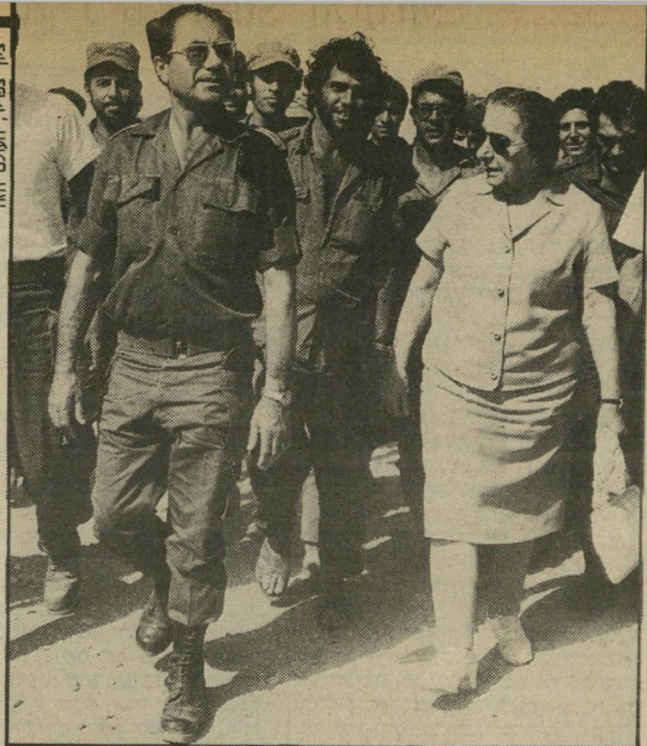
גורודיש עם גולדה (1973) והשבוע בבית-המישפט האם העמותה היתה תרניל?