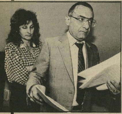
תובע עמרמי, טענותיו, הטעייה ותרמית.

לדברי התביעה המשיך גורודיש לעיבוד עם שותפיו האחרים, להרוויח כספים (המשך בעמוד 58)