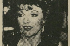
אלכסיס קרלינגס נוצר כמו אצלנו

נתחיל בקריסטל. נראה שהמפיי-קים רוצים להיפטר ממנה, או שהיא