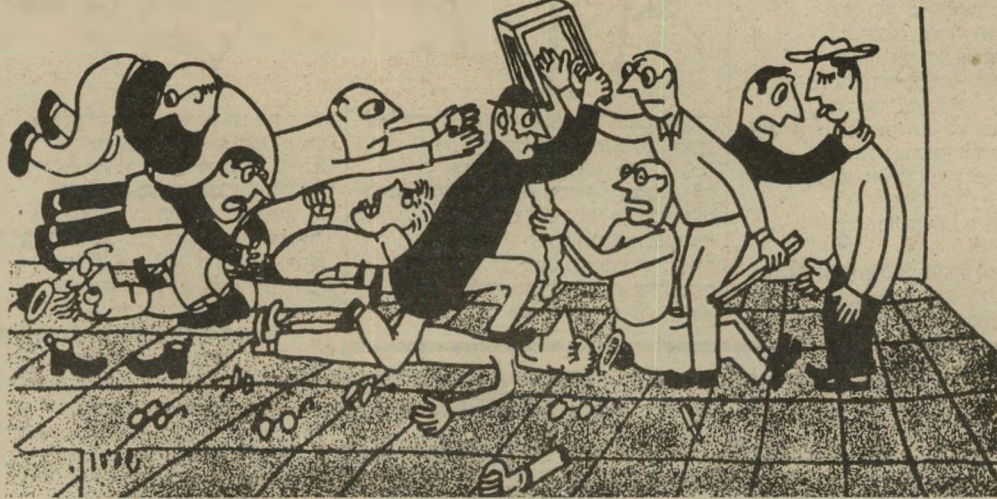
חברי הכנסת בויכוח על... קריקטורה של שימעון צבר (1950)

לפני שאנעל את הישיבה שלא מן המניין, אני רוצה להזכיר לכולם שסדריות הדיונים היום היא חיונית