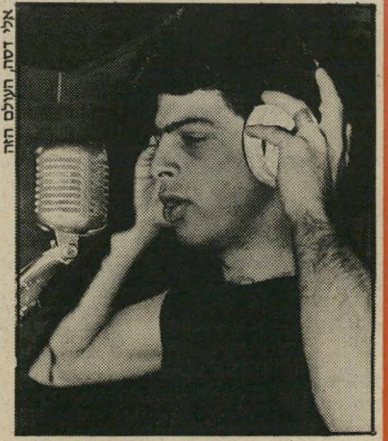
ליהוד: יוצר בלי שם-מישפחה

במחינה מוסיקלית הם ממקדים את עצמם בין רוק למוסיקה שחורה. הגדרה