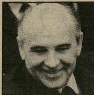
גורבאצ'יב מה זה שוהו?

טובליה מהקנפצקיה יודעת שלהצהיר הצהרות פור-ליטיות זהו מתכון המאושש מיסחורית וכלכלית אצל החברה בשמאל (ראו מיקרה אלמגור הנשכח). ועם רקע קיבוצניק כאלה, הישיתה לעצמה להתמודדות מעל דפי "התוספת" של חדשות, ש"אני הייתי גרופי