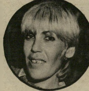
מובילה מה היא מוכרת?