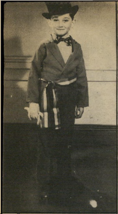
ז'אן פייר בילדו (1949) לברוח — מפני מה?

מושל מחוז ז'ירונד. שם מתייחסים אליו מאוד ברצינות. הוא פרופסור ומנהל קאזינו. איש חשוב. ז'אן פייר מסביר שבשעסקים הוא חייב להיות שקוף. שקוף פירושו — להראות הכל. כדי שלא יחשדו בו, חסד וחלילה, ושיראו שהוא ישר ואמין. בחיים הוא לא שקוף, כי אם יגלה הכל על עצמו הוא עלול להיפגע. בכיקור בארץ הוא היה "קצת שקוף", כי הוא אוהב את האנשים. קצת גילה על עצמו, ומיד חזר לדבר בהצהרות שהכין מראש. ושוב הצייץ וסיפר סיפור אישי, אך תפס את עצמו בזמן וחזר לקטיעיהעיתונות הרציניים. לדעתו אין בו הפכפכות וחוסר יציב בנות. אין בו סתירות. פשוט חסרות 17 שנה, שעליהן לא סיפר. רק מי שידוע מה היה בהתחלה, יכול גם להבין את ההמשך.