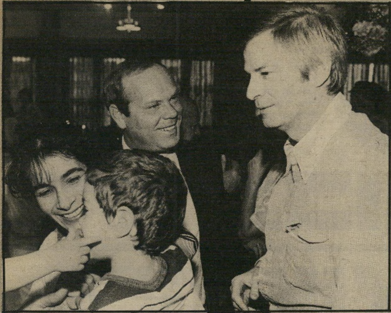
אריק איינשטיין (מימין), סימה אליהו ובנם אמיר (משמאל) בחודש השניש

אני בטוחה שאתם לא יודעים זאת, אבל הזמר המולרי אריק איינשטיין מאוד מאושר באחרונה. זה לא רק מפני שהוא חיתן את בתו יסמין עם שלום , הבן של חברו הטוב אורי זוהר . זה גם מפני שחברתו-לחיים, סימה אליהו , אם בנו בן ה-6 אמיר , היא בהריון בחודש השלישי. כלומר, בעוד כמה חודשים יהיה הזמר הלאומי אבא לילד שיהיה יותר צעיר מנכדיו.