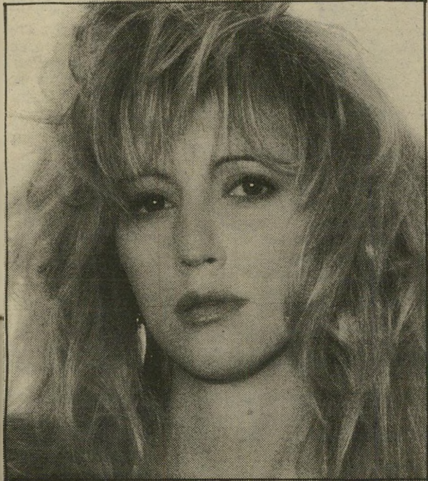
שרי אורון חוש הומור ושירים במגירה

סיפר לי נהג-מונית: לקחתי חתיכה אחת, עם המון אימור על הפנים, לאיזה מקום מחוץ לתל- אביב. שאלתי מה המיקצוע שלה, והיא אמרה: אני בפיירוסום. כאשר הגענו, היא ביקשה שאמתין לה במשך שעה. הייתי בטוח שהיא נערת-טלפון, בדרך-כלל זה לוקח אצלן שעה. בנסיעה חזרה שאלתי אותה: למה אמרת שאת בפיירוסום? והיא אמרה: בטח שאני בפיירוסום, אני מפרסמת מודעות בעיתונים.