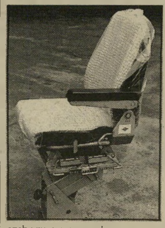
מתאים עצמו ליושב בו, ומאפשר לנהג ישיבה נוחה בלי תופעות-לוואי. זה שמראהו היחצוני דומה יותר לסדר עינניים מאשר לכורסה נוחה - זה פשוט עניין של אשליה אופטית.

ארבעה מתרגלים מדריכים אותך כי שיעור יומי של 15 עד 30 דקות, בשישה ימים, כל אחד בן-שבועיים. ה-קלטת מומלצת על-ידי האגודה לכאי-בג וכתה בפרס המצויינות של המועצה המייעצת לטרטים. המחיר: 43 דולר, כולל מישלוח ואחריות.