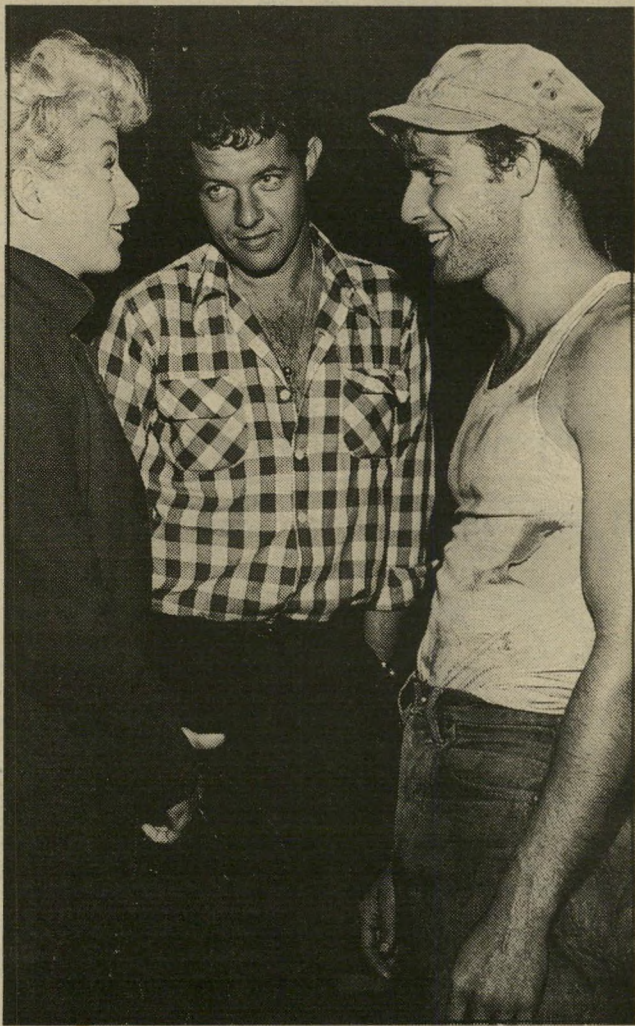
בין מרלון ברנדו ושלי וינטרס (1950) בהסרטה "חשמלית ושמה תשוקה" השולחן העגול של המלך ארתור והמערב הפרוע