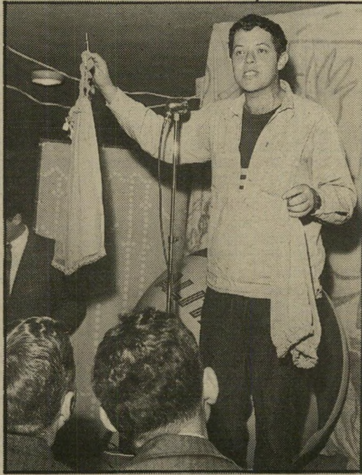
במכירה פומבית (1960) ילד שוולה רוצה להיות מקומי

בן הארץ החדשה הוא תמיד דמות איראית, ולמיצחו נקשרים כתרס שונים, אמיתיים ומדומים. הוא נחשב ככריא, כחסרתסביכסיג, כגיבור, כקופיקומה, כפאריהיצירה של המולדת החדשה.