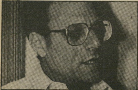
מנכ"ל סלנט לא מהפכני, לא מיוחד

כל מעורפל בתוכנית הזאת: הניסוח, הרמזים וחצאי הרמזים, הפריצות בהבטחות והיכולת להתחמק מהן, כמו המינוח שמשתמשים בו. במיקרים מיוחדים (איזה מיוחדים?)