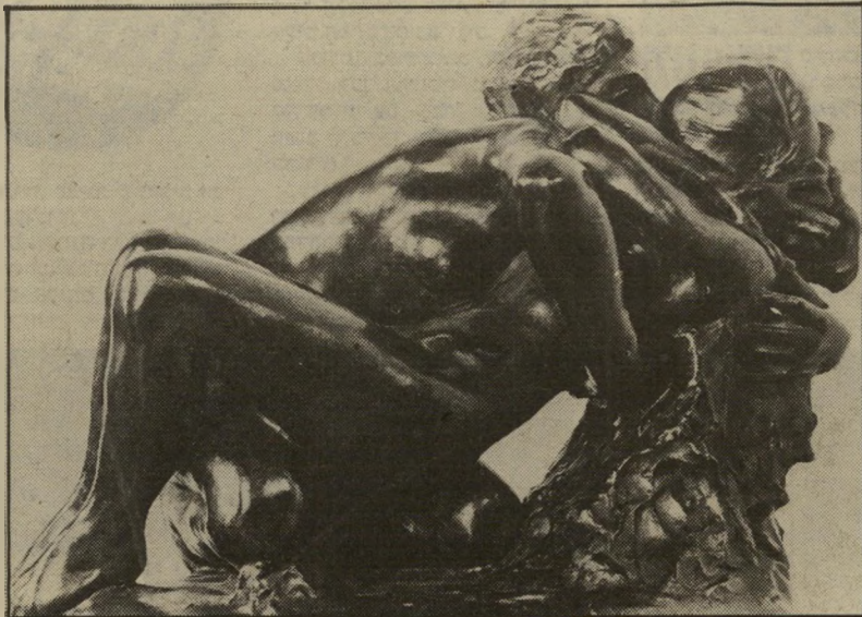
אוגיסט רודין: לדעת אשה (המטמורפוזה של אובידיוס)

הכל צועק: מצב קיומי, מצב קיומי! מצב קיומי בנוף ישראלי מאוד. היותו של גי' בור הספר איש מוסד' לשעבר שרירותית אבל גם סימלית ורלבאנטית. המוסד, השב"כ הם סחורות יצוא מבוקשות זה שנים בעיני סוכני הרכש של הוצאות ספרים זרות בירידים בינלאומיים. אבל סוכני שב"כ, מוסד מדוברים גם אצלנו, אין שבוע שאינם בחרשות. הם the out in לסירוגין. אבל הם גם המשך "טיבעי" כביכול לאותם אלופים ומ' פקדי צה"ל הבכירים שהקימו אותם בספרות, לאחר שנסתלקו ממנה מרבית ה"אליקים", ה"אר' רים" וה"אפרימים" שסתם הלכו בשדות לתומם. איש מוסד הוא כמובן בראש וראשונה איש שותק, איש מחריש, איש הנושא את בשרו בשיניו. בהיבט זה, הוא ממשיך טיבעי למיתוס המוצר לכולנו: "בני גדול ושתק... הוא נושא בליבו כדור עופרת". שתיקתו של אלתרמן הפכה ל"שתיקתם" של חיים גורי ושל ס. יזהר. מורים לספרות ידעו להצביע לאחור אל מגילת היוחסין שלה: השתיקה והגימגום אצל גיבוריו של ברנר, "שתיקת הים" של ורקור הצרפתי האנטי-נאצי הנשכה. מרחיקי-ראות שביניהם אף יזכירו את הרומנטיקה — מנובאלים הגרמני ועד מטתו של מטרילינק על דבר יתרון השתיקה על פני הדיבור.