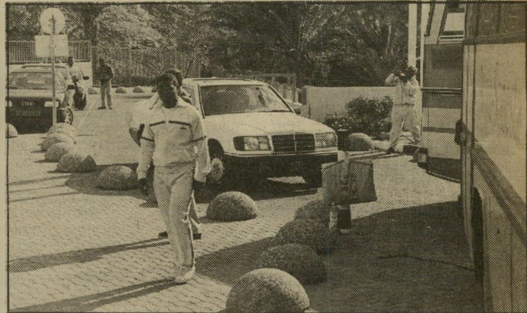
מיספר מצרי מכונית מרצדס לבנה, נושאת לוחית-זיהוי בערבית, חנתה בפתח המלון וממנה יצא גבר מצרי. מטרים ספורים מאחוריה חנתה מכונית עם מיספר-זיהוי ישראלי.