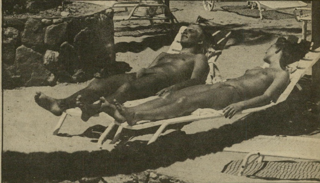
סוף, שאלו יש כעת גישה ישירה מהמלון. זאת היתה השבת הראשונה מאז ההסכם שהמקום היה מלא. רוב האורחים היו ישראלים והיו גם תיירים מצריים.

לה המאחרות התהליך אורך פחות מרבע שעה. המלון היה גדוש מצרים, חלקם בגלביות ומרביתם בלבוש מערבי-שמרני. הנשים בשמלות פשוטות, הגברים בג'ינס או במיכנסים-גבריים ומיעוטם במיכנסיים קצרים. וביניהם נראו ישראלים המככים כטורי-הרכילות — דוגמניות, נערות-זוהר, אמנים, אנשי-שיעסקים ובנים למישפחות עשירות. בכפיפה אחת ניתן היה לראות חתיכה ישראלית במיני צוערת בלובי