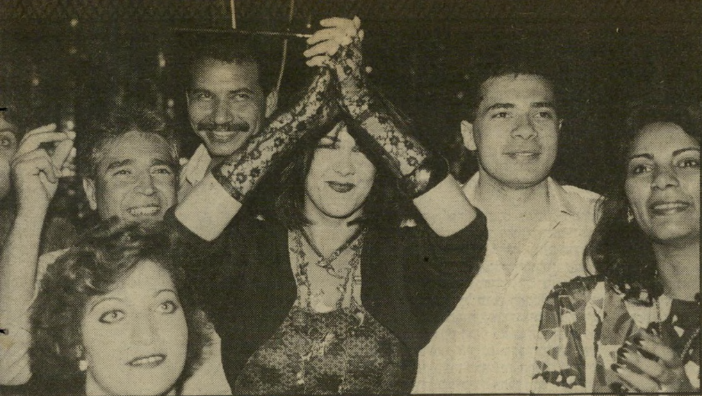
התלהבו משירתה וביקשו להצטלם עימה. לצידה אני שיעסקים צעירים מקאהיר ונשותיהם, שכל-כך התפעלו מהופעתה שהחלו לצלמה במהלך ההופעה.