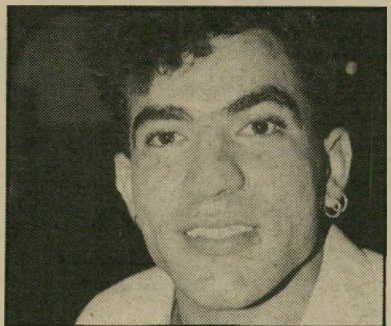
פיקולו: "מה שיש לי בין הרגליים, זה גידול!"

"רק יותר מאוחר הבנתי שיש דברים שלא מספרים לנו עליהם, שם בלישיבה. היתה לי ההר"גשה שאני רוצה לשנות משהו בחיים. אבל לא