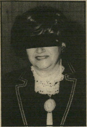
אמו של הבעל, אווה בשנת נידה.

לדברי התובעת אין כל קושי להרויב-בעלה לספק את מזונותיה מהסכום מים העצומים שהם משתכרים, מה גם שהם משתמשים בכסף הנתרם לישיבה ככספם, כלי לתת דיווח-שבוך לאיש.