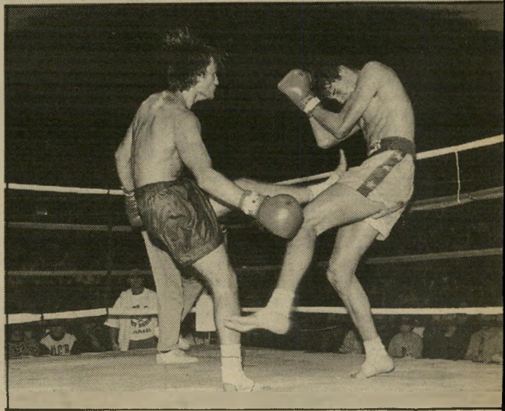
בעיטה באשכים, לא לשחקו להרביץ חוקי

חבלות, בעיטות בכל גופי. אף איבר אחר לא ניצל מפגע רע או מחבלה. באותו לילה ובלילות שאחריו הפכתי מומחה לקומפרטים. לא נכנעתי, לא ברחתי, וכבר יומיים לאחר מכן הופעתי לאימון כשאני חבול, חבוש, מנופח ושרוט. באימונים הבאים נמשכה קבלת־הפנים הממלכתית. הפכתי אטיאט לתא־בוקסר מן השורה.