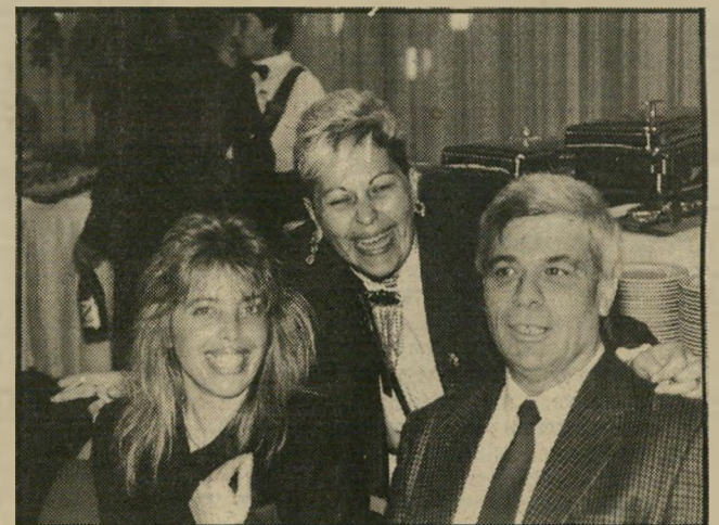
פרופסור חרוזי (עם ידידות) בין בארשבע להרצליה

של המומחים שלנו, ובאשר תצטרפו לתוכנית תקבלו את הרשימה ותבחרו מבין הרופאים מהרשימה למי לפנות. "או איפה בבחירה החופשית שאתם מכתיחים?" התפלאה אריאלה.