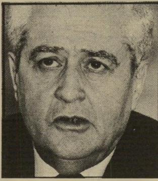
בנקאי יפת מסיכוסה, מע"מ ושענות ווספות

עצה אחת אני מוכן בכל זאת ללחוץ לאוזנו. תשמע, אני אומר לו, אם עד עכשיו לא נכנסת לבורסה, במניות אני מתכוון, תיכנס. נניח 5% או 10% מתיק החיסכון שלך יכיר לים לעשות סיבוב בכמה מניות כבדות. יעשו בכל מיקרה יותר מצמודי-מדד ודולר.