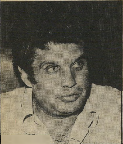
פרקליט מושגב — נראה לא תקין

עדיין סיכוי שבית-הדין יחזיר את יהלום בעונשו וישאירו בבית-הסוהר. "בעם לפגם". למרות המיברק, לא התייצב עורך-הדין מישגב לפני בית-הדין העליון, ושלה מיכתב: "כל ההליך של הקרמת העירעור נראה לאתקן על-פניו. איש לא הזמין את הסניגורים לדיון בבקשה להקמת הדיון, ולא ביקש את תגובתם..."