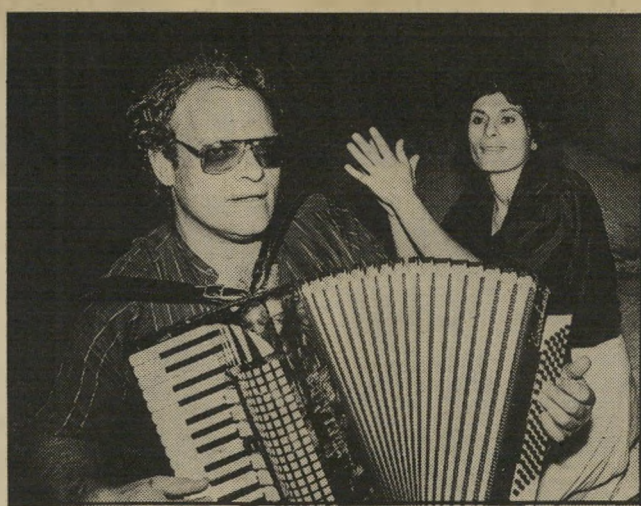
סוכן ביטוח מדנס (במסיבה) מי מרוויח? כמה?

מיברק בהול נשלח לסניגור לתל-אביב ב-18 בפברואר. במיברק הודיעו למישו כי עליו להתייצב לעירעור, שהוקדם ל-27 בפברואר. עד מועד זה קיוותה התביעה כי תצליח לרדות את שיחרורו של יהלום מהכלא, ויהיה