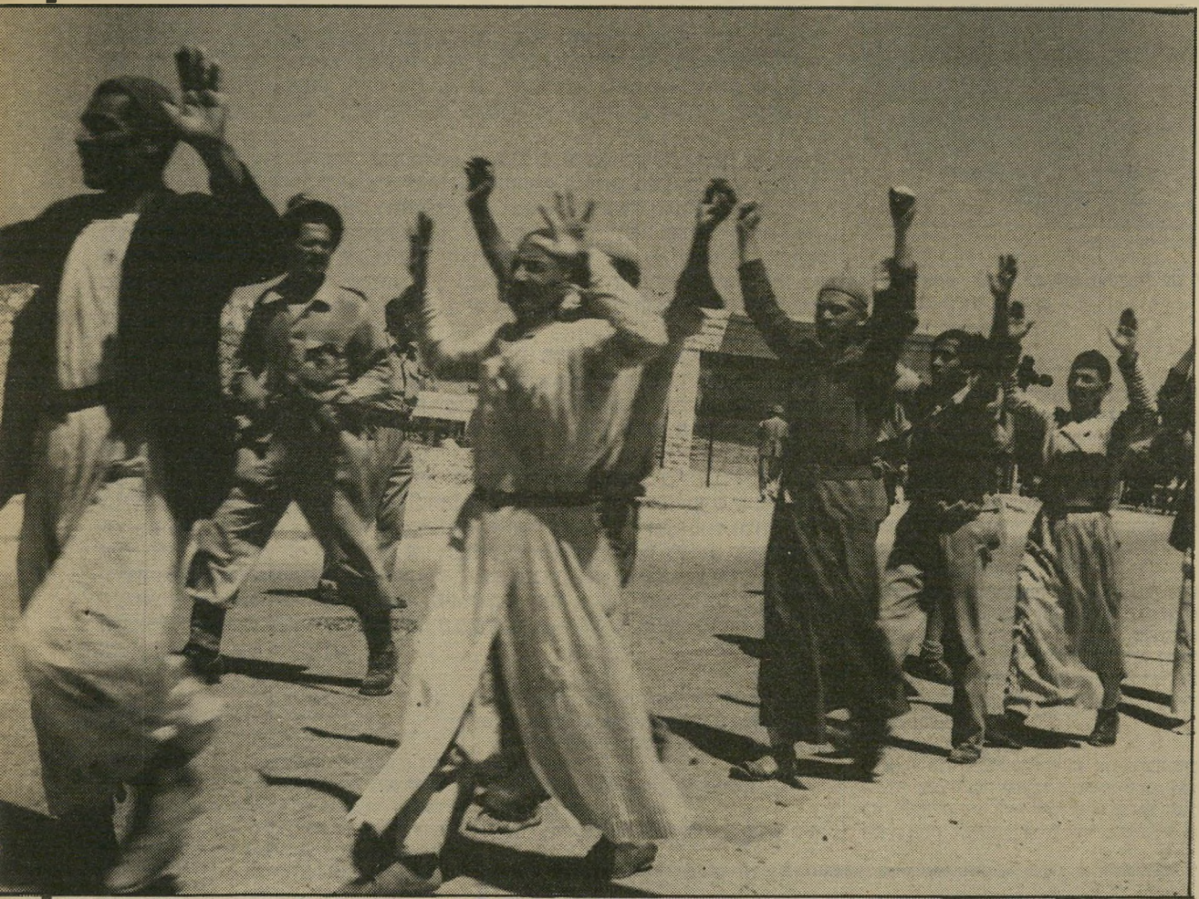
גירוש הערבים מרמלה למחרת הכיבוש אותו הדבר, אבל בשלבים

היסטוריונים אלה היו כרוםב אנשי-צבא שוליים בתחום המינצעי, שהועלו לדרגות ככר