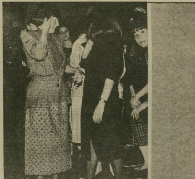
עזרת נשים חלק מהנשים, שהרגישו מקופחות בגלל המחיצה שהמרידה ביניהן לבין הגברים, הצטופפו בפתח הצד, וצמו בשימחה הגדולה בעזרת הגברים, עד שנתבקשו לזוז.