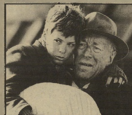
מאכס פון-סידוב ופלה הוונגארד

מקום לגזע הנחות לבקש זכויות כלשהן. פארקר, מיקצוען היוזע היטב כיצד לעבוד על האינסטינקטים של צופיו, ואינו נמנה על המדקד-קים באתיקה, מחלק את הדמויות לכמה סוגים ברורים: הסוכנים המדוללים הסובים, בני המקום הלבנים הרעים, והשחורים שהם הקורבנות. הוא עושה זאת בעילות רבה ובתמונות מרשימות. קשה שלא להשיחך בנועשה על הבד ולא להתקומם נגד מציאות שאכן קיימת, גם אם יש לה יותר גוונים.