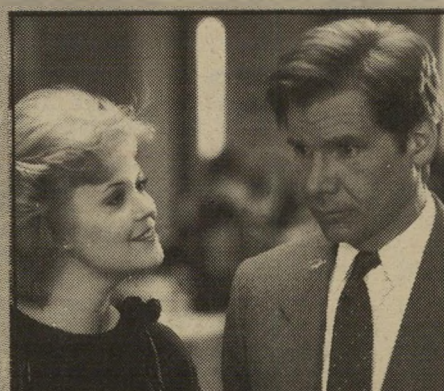
האריסון פורד ומלאני גריפית: מוכשרת למכור אותו כהמצאה פרטית שלה. בקיצור, בארא-קודה אמיתית.