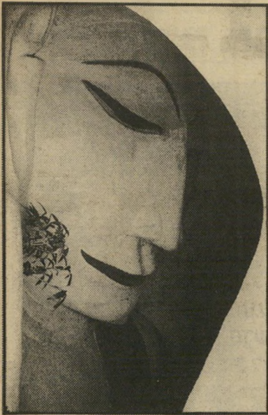
מסל בורמאי: להגיע יותר עמוק!

כרורות. הסקרנות נגמרת במקום, שבו אתה צריך לייצר תוצאות. אם מדברים על ציד, זה כמו לצוד עוף קפוא בסופרמרקט, לצאת עם כל הציד לסופרמרקט, ואז לשלוח את העוף הארוז מתוך המרפ. עבודת הצלם היא ההצבעה שלו על דבר מסוים בדרך מסוימת. שני אנשים, שיראו את אותו דבר, לעולם לא יקבלו את אותה התוצאה. אני מקשרת בצילום בין דברים שלא קשורים זה לזה. פסל בנורמה וילר ביבנה, שניהם ישרו את אותו הדבר. מה שמקשר ביניהם זה האצבע שלי שמצביעה". ומה היא רוצה לעשות כשתהיה גדולה? להמשיך לצלם!