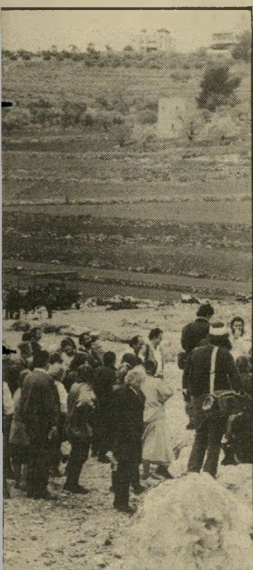
עית סרטוסטי, העולם הזה

אז עבר המגאפון לח"כ צוקר. הוא עלה על סלע בצד הדרך ואמר, בין השאר: יש פה מאות אנשים שביקשו