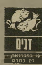
19 בפברואר - 20 במרס