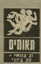
21 במאי - 20 ביוני