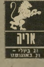
21 ביולי - 21 באוגוסט