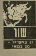
21 באפריל - 20 במאי