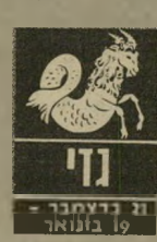
21 בדצמבר - 19 בינואר

המצב המישפחתי נוח יותר. גם אם יש חולשים, לא כל העול מוטל כרעג עליכם, ועכשיו תוכלו לשבת בבית, לשפץ, לקשט ו"ליהנות מאורחים. שי"מוץ או מעבר לדירה יכול לעלות על הפרק, אבל תחשבו היטב אם כדאי לכם להיכנס ל"התחייבויות כספיות גדולות, משום שזו אי"נה השנה הנוחה מב"כסף עשוי להגיע ב"16 בחודש, ואז תוכלו לרכוש לכם משהו שיקל מאוד על החיים.