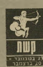
21 בנורמבר - 20 בדצמבר