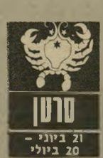
21 ביוני - 20 ביולי