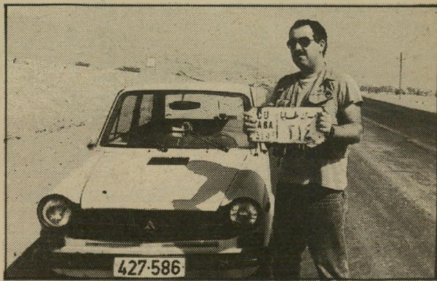
הצלם ציון צפירי בנואיבה, הם התגובו לחדר...

המצרים נותנים אלפיים לירות לגמל. הישראלים נתנו רק 500 שקל, אומר סלימאן בעברית. יש פרנסה, אבל אין הרבה עבודה. התיירים מעטים מאוד, אבל לי לא איכ