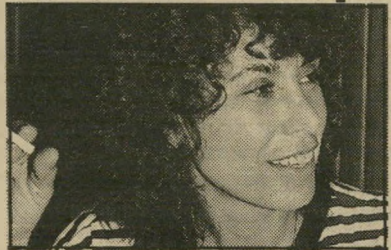
קייני: "לעבור דרך המיניות של הגבר" על כימה לגיטימית, בתיאטרון הרפרטוארי. שיי-קה וינברג אמר לי בזמנו "את האשה הראשונה, שאני חותם איתה על חוזה". זה לא נראה או כפריצת-דרך. בתיאטרון קיי-מת אפלייה מועטה. אם טכסט הוא טוב, לא מסתכלים לך מתחת לחגורה כדי לברוק בוה — גבר או אשה. אני לא יוצרת מיסגרת חדשה, אלא יוצרת במיסגרת קיימת, שנוצרה על-ידי גברים. רמת המודעות שלי היא ברעבר. בזמן העבודה

אני עושה מה שבא לי. אילו היה משהו הנוגע למעמד האשה שהיית יכולה לשנות, מה היית עושה? הייתי משנה את תהליך-החינוך. חוקי-החינוך-החובה צריך להתחיל בגיל שנתיים — לשנות את עולם הדימויים, שעליהם יגדל הדרך הבא. הייתי מחוקקת חוק הגורר מאסר-עולם על גברים, המכים נשים וילדים. ● את מגדירה את עצמך כפמיניסטית? זה תלוי באיזה מצבירות תופסים אותי. לפע-מים אני נתקלת בפמיניזם דוגמטי וקיצוני, או אני פשוט רוצה שירד לי מהגב. אני מאמינה שצריך לשאוף לשיוויון. זהו מאבק שצריך להיעשות על-די נשים וגברים ביחד. אני אחיה טוב יותר בעולם שבו יש שיוויון בין נשים וגברים. ● יש לך מה להגיד לנשים אחרות לרגל "יום האשה הבינלאומי"? כן, המילה "פמיניזם" לא נוסחת: