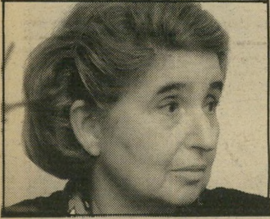
כהנא-כרמון: הגבר מול האשה ללא ספק. הספרות העברית היא שמורת-טבע, המפגרת הרבה אחרי המצב בשטח. רהינו, אחרי פני הדברים במציאות עצמה. זורק שאלה של זמן.

רוש ספר המטפל בבעייה מרכזית ביותר: הרי קנות, היציאה לפנסיה ומהמירוץ, חרדות האימי-פוטנציה ואיך-האונים, המיתרות. על ספר שיטפל בזה יאמרו מבקרי-הספרות שהוא הסמל לישראל בשנתה ה-40. לכתוב על אשה מזוקנת — הריקנות, הילדים שעובו את הבית, החרדות שמא איננה יותר אשה מושכת, הרגשת המיתרות — זה לכתוב על רבי רים טריוויאליים. זה לכתוב על מה שקורה בעי-רת-הנשים. ● גם גברים כותבים על חרדות של נשים. זכותם. אבל אלה הן נשים כפי שגבר רואה את האשה. לא כפי שהאשה תופסת את עצמה. זה כערך כפי שלא-יהודי יכתוב על להיות יהודי, לעומת האופן שבו יהודי תופס את עצמו. ● את הרשבת שיש למצב פיתרון?