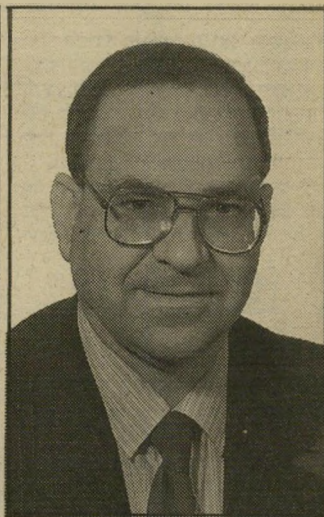
שימעון שיטרת הכי פרלמנטרי